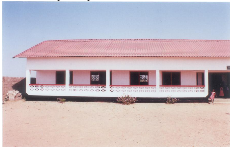
Dezelfde halve school

Ik ben op zoek naar schoolmeubilair voor 2 Primary Scholen in Sarakunda en in Jarra Sukuta waar we ook bezig zijn met een waterput, wie weet er een school die nieuw meubilair wil gaan kopen?